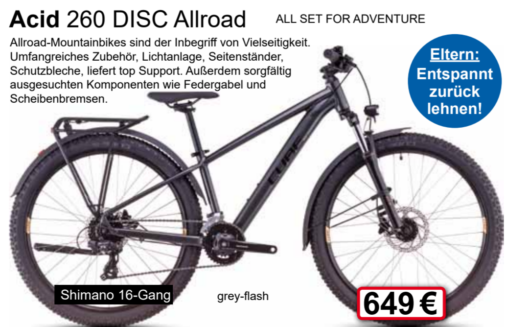
Shimano 16-Gang grey-flash 649 €

Allroad-Mountainbikes sind der Inbegriff von Vielseitigkeit. Umfangreiches Zubehör, Lichtanlage, Seitenständer, Schutzbleche, liefert top Support. Außerdem sorgfältig ausgesuchten Komponenten wie Federung und Scheibenbremsen.