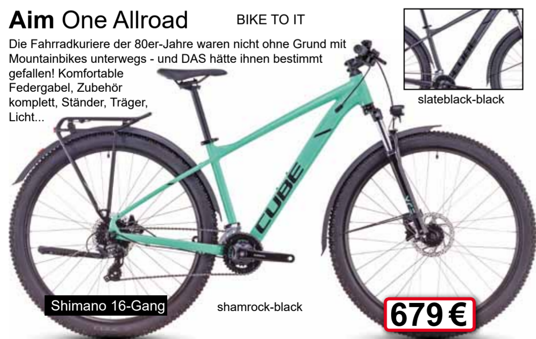
Shimano 16-Gang shamrock-black 679 €