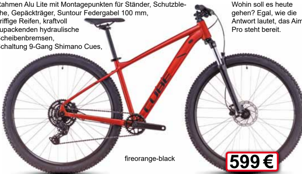
fire orange-black 599 €

Rahmen Alu Lite mit Montagepunkten für Ständer, Schutzbleche, Gepäckträger, Suntour Federung 100 mm, griffige Reifen, kraftvoll zupackende hydraulische Scheibenbremsen, Schaltung 9-Gang Shimano Cues, Whoin soll es heute gehen? Egal, wie die Antwort lautet, das Aim Pro steht bereit.