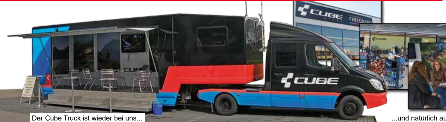
Der Cube Truck ist wieder bei uns...

Wir laden ein mit uns die Fahrradsaison 2025 zu starten. Wir feiern 1 Jahr CUBE Store Friedberg Rückenwind!