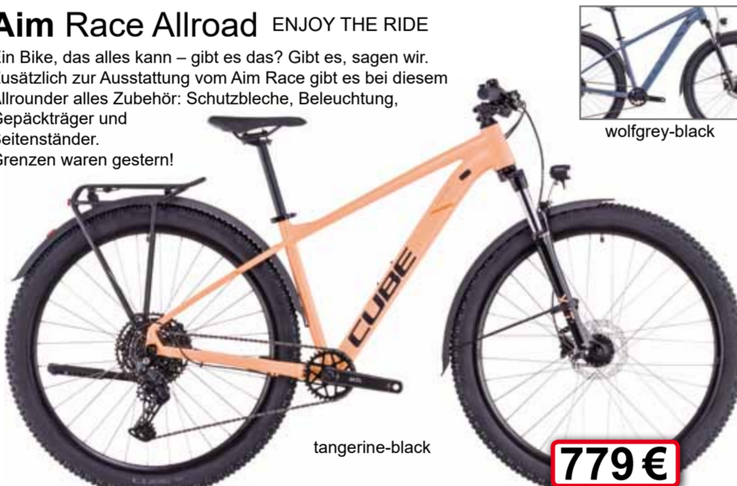
tangerine-black 779 €

Ein Bike, das alles kann - gibt es das? Gibt es, sagen wir. Zusätzlich zur Ausstattung vom Aim Race gibt es bei diesem Allrounder alles Zubehör: Schutzbleche, Beleuchtung, Gepäckträger und Seitenständer. Grenzen waren gestern!