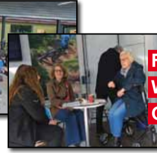
...und natürlich auch wieder...