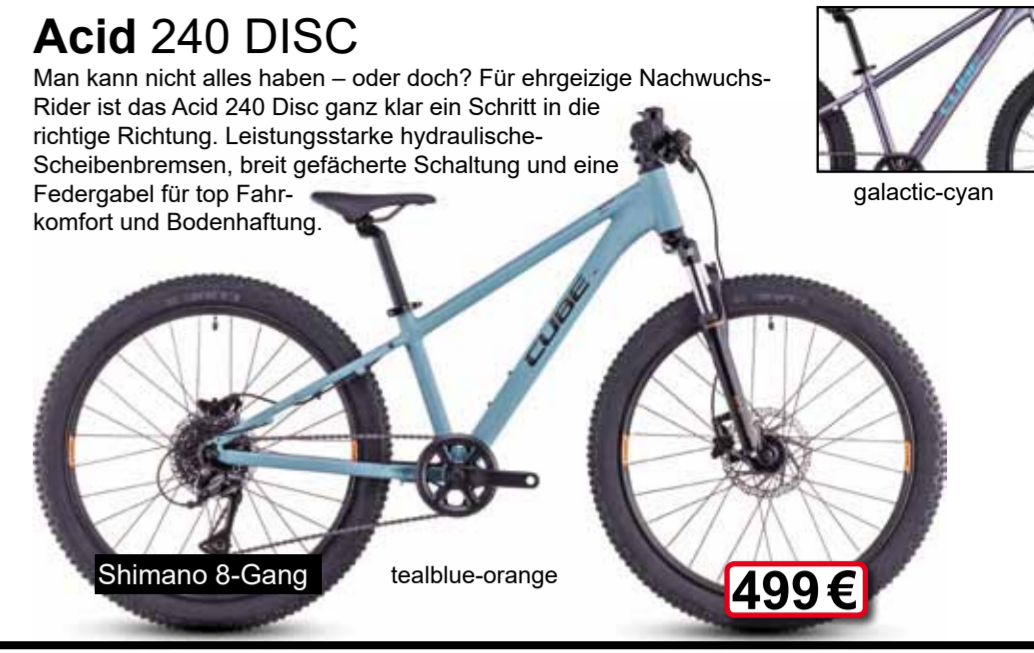
Shimano 8-Gang tealblue-orange 499 €

Man kann nicht alles haben - oder doch? Für ehrgeizige Nachwuchs-Rider ist das Acid 240 Disc ganz klar ein Schritt in die richtige Richtung. Leistungsstarke hydraulische Scheibenbremsen, breit gefächerte Schaltung und eine Federung für top Fahrkomfort und Bodenhaftung.