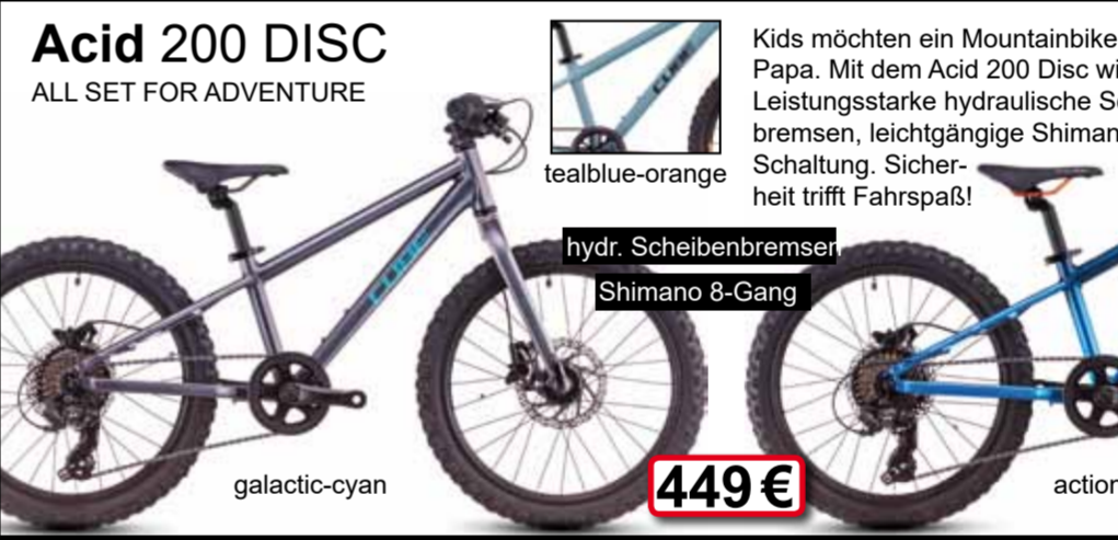
galactic-cyan hydr. Scheibenbremse Shimano 8-Gang 449 €

ALL SET FOR ADVENTURE Kids möchten ein Mountainbike wie das von Mama oder Papa. Mit dem Acid 200 Disc wird dieser Traum wahr! Leistungsstarke hydraulische Scheibenbremsen, leichtgängige Shimano 7-fach Schaltung. Sicherheit trifft Fahrspaß!