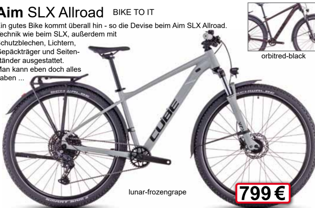
lunar-frozensgrape 799 €