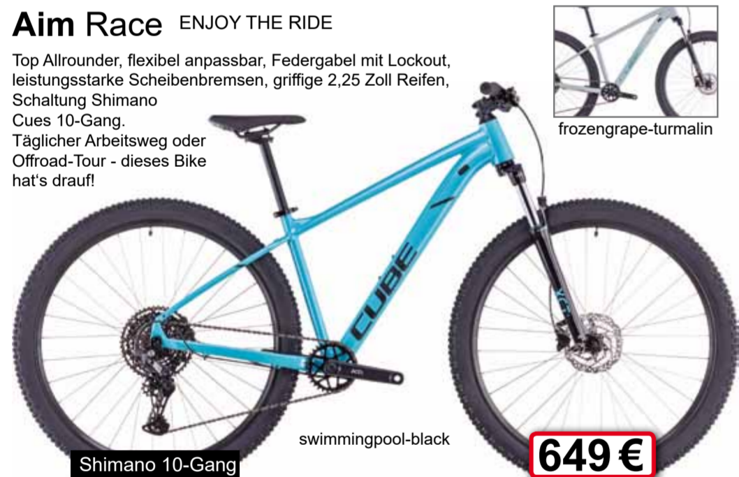
Shimano 10-Gang swimmingpool-black 649 €

Top Allrounder, flexibel anpassbar, Federung mit Lockout, leistungsstarke Scheibenbremsen, griffige 2.25 Zoll Reifen, Schaltung Shimano Cues 10-Gang. Täglicher Arbeitsweg oder Offroad-Tour - dieses Bike hat's drauf!