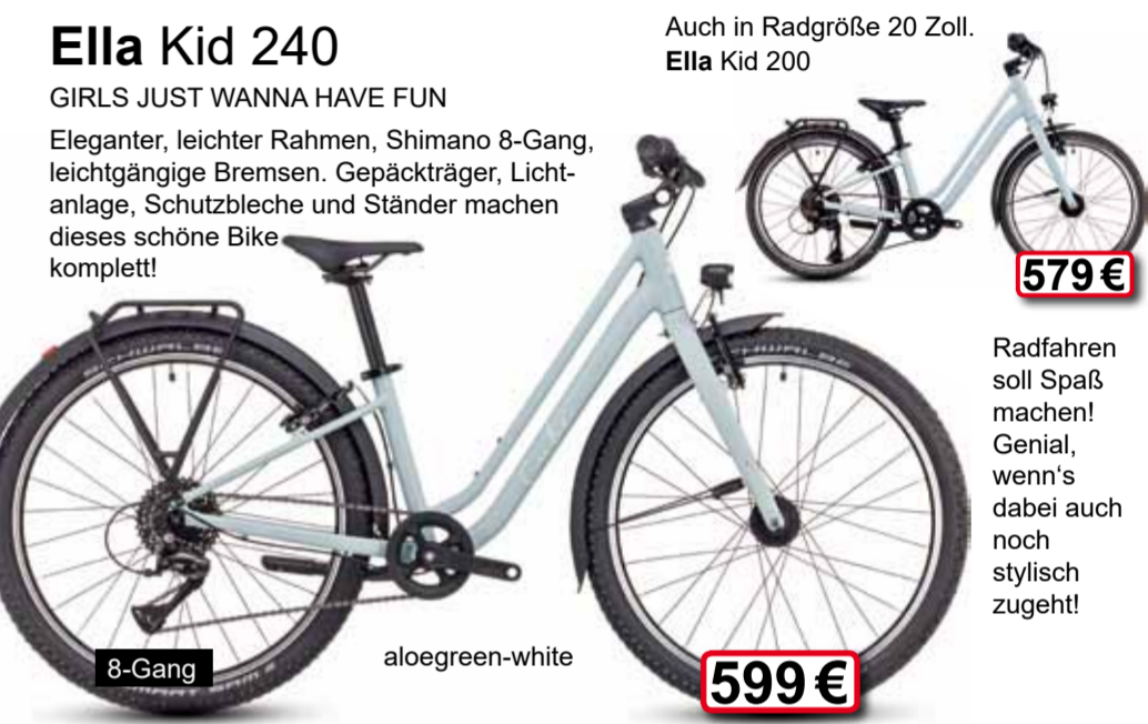
8-Gang aloe green-white 599 €

GIRLS JUST WANNA HAVE FUN Eleganter, leichter Rahmen, Shimano 8-Gang, leichtgängige Bremsen, Gepäckträger, Lichtanlage, Schutzbleche und Ständer machen dieses schöne Bike komplett!