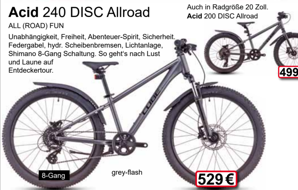
8-Gang grey-flash 529 €

ALL (ROAD) FUN Unabhängigkeit, Freiheit, Abenteuer-Spirit, Sicherheit. Federung, hydr. Scheibenbremsen, Lichtanlage, Shimano 8-Gang Schaltung. So geht's nach Lust und Laune auf Entdeckertour.