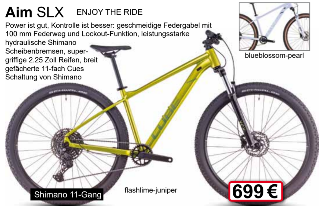
Shimano 11-Gang flash lime-juniper 699 €

Power ist gut, Kontrolle ist besser: geschmeidige Federung mit 100 mm Federweg und Lockout-Funktion, leistungsstarke hydraulische Shimano Scheibenbremsen, supergriffige 2.25 Zoll Reifen, breit gefächerte 11-fach Cues Schaltung von Shimano