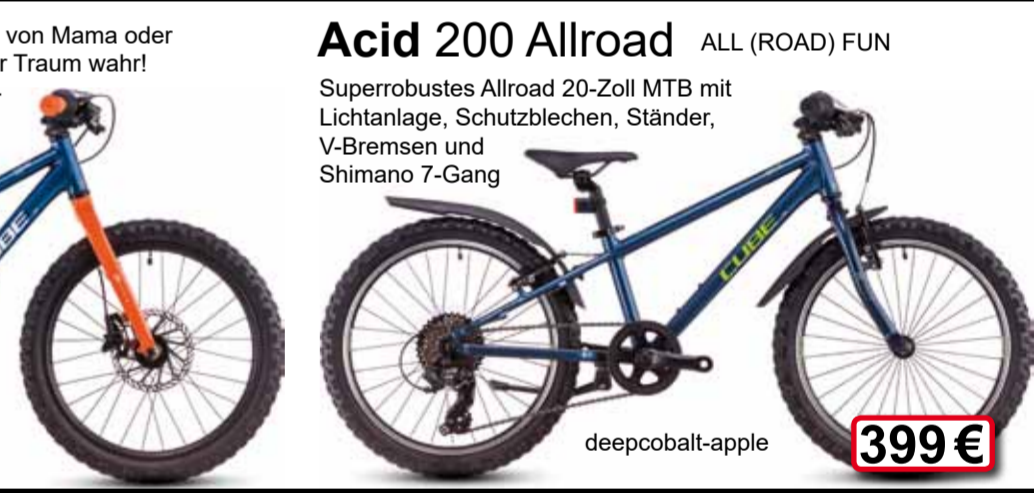
deepcobalt-apple 399 €

Superrobustes Allroad 20-Zoll MTB mit Lichtanlage, Schutzblechen, Ständer, V-Bremsen und Shimano 7-Gang