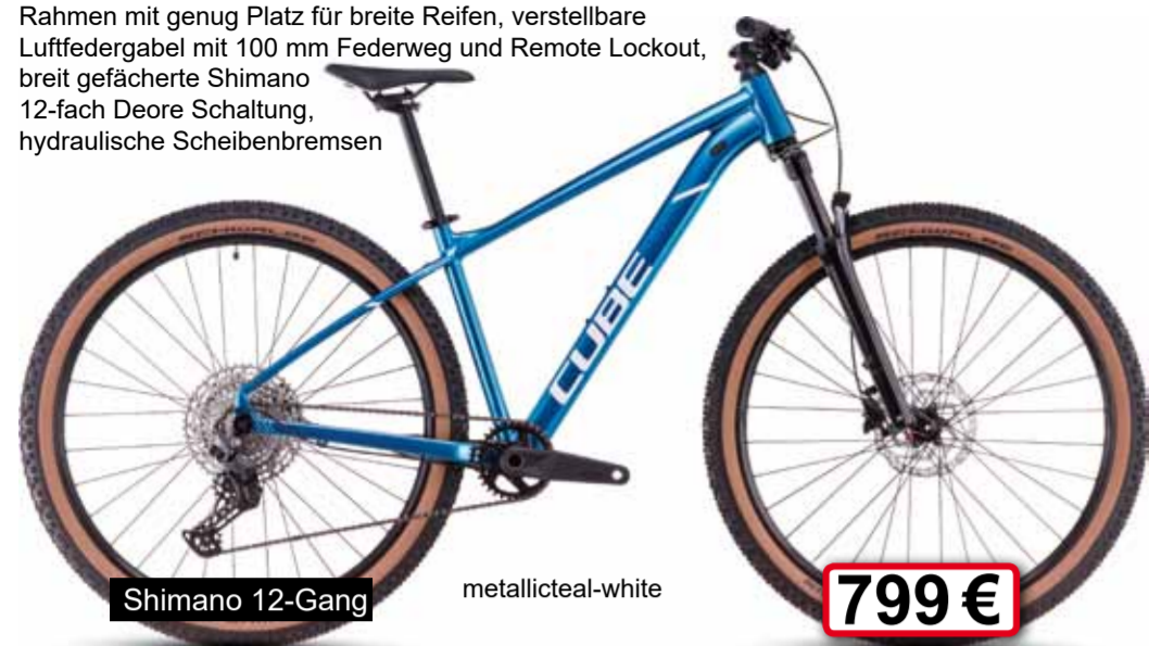
Shimano 12-Gang metallic teal-white 799 €

Rahmen mit genug Platz für breite Reifen, verstellbare Luftfederung mit 100 mm Federweg und Remote Lockout, breit gefächerte Shimano 12-fach Deore Schaltung, hydraulische Scheibenbremsen