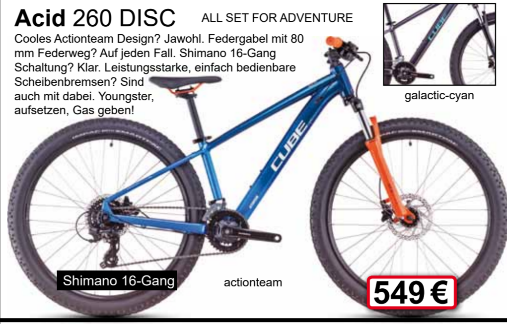
Shimano 16-Gang actionteam 549 €

Cooler Actionteam Design? Jawohl. Federung mit 80 mm Federweg? Auf jeden Fall. Shimano 16-Gang Schaltung? Klar. Leistungsstarke, einfach bedienbare Scheibenbremsen? Sind auch mit dabei. Youngster, aufsetzen, Gas geben!